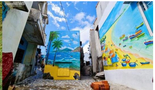
Làng Bích Hoạ Nhơn Lý